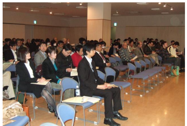
▲パネルディスカッションの様子

当日は、前半のパネルディスカッションでは定員に近い約200名の来場者があり、充実した開催となりました。